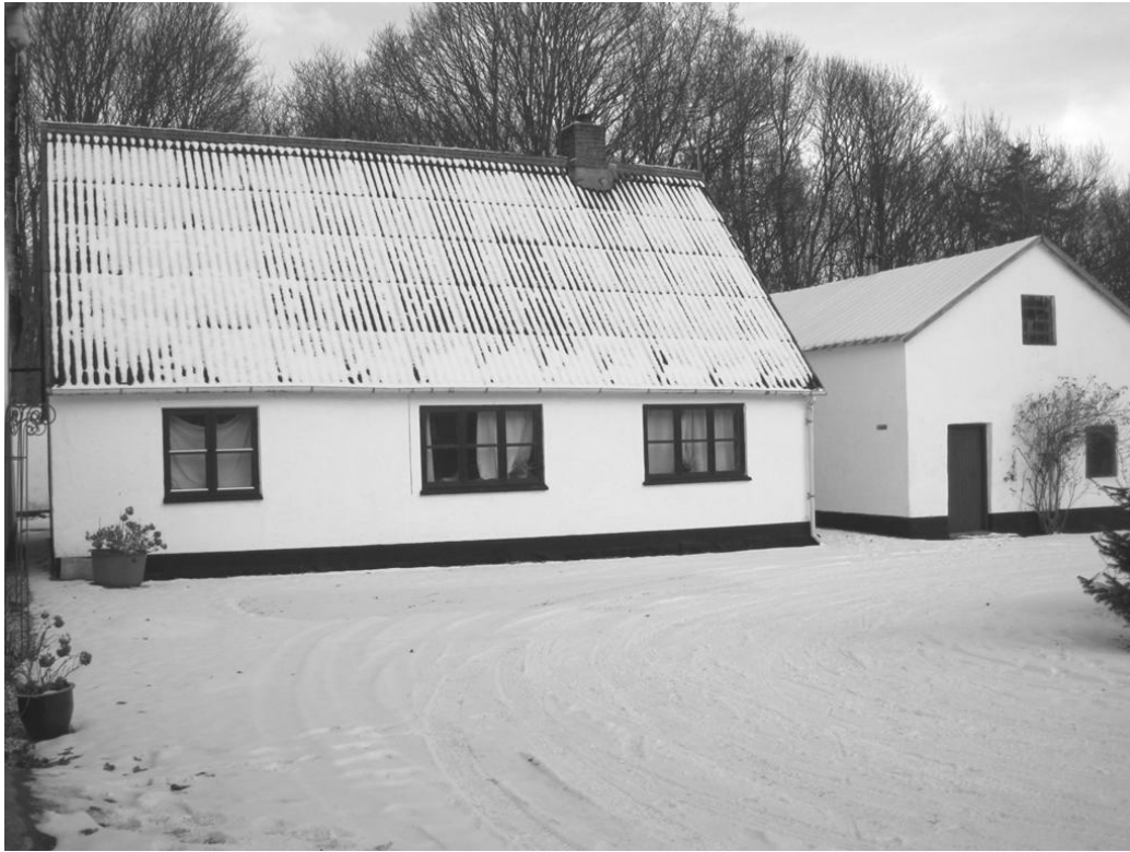
Evelinero februar 2013