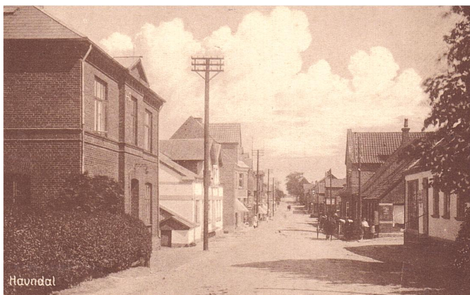
Gadeparti fra Havndal. Til venstre Posthus og Mejeri. Ca. 1930

I 1892 byggedes andelsmejeri, som behandler mælken af 1000 køer. Hedeselskabet har også i denne periode sat sit spor her på egnen. Først i Overgaards Nørrekær og senere den store inddæmning fra Nøddenæs til Sødning, hvor digerne nu forhindrer højvandet i at trænge ind over flere hundrede tdr.land; desuden har Hedeselskabet ledet afvandingen af