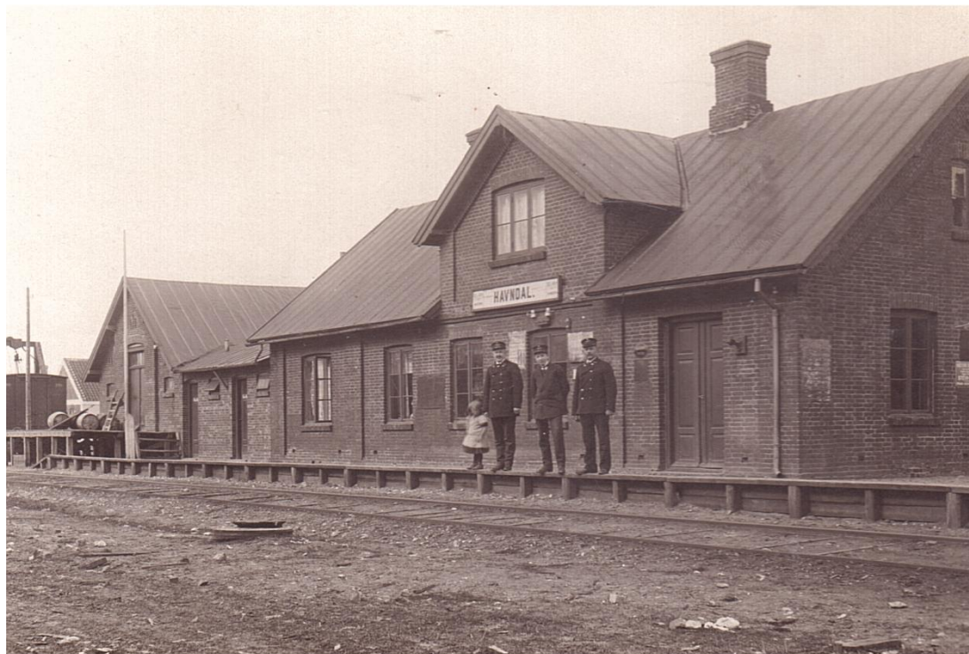
Havndal Station. Ca. 1910