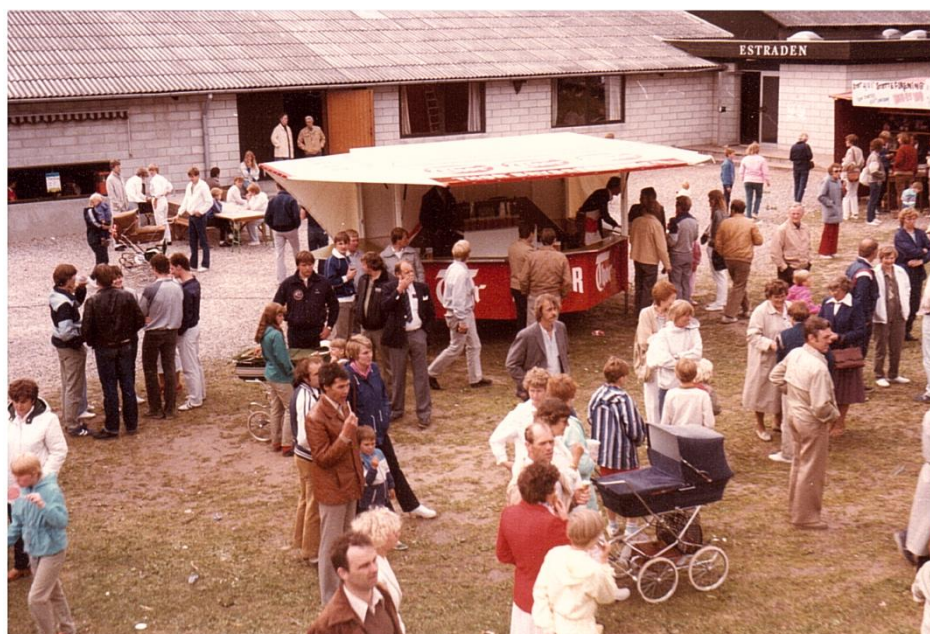
Børnefest med den nye Estrade i baggrunden