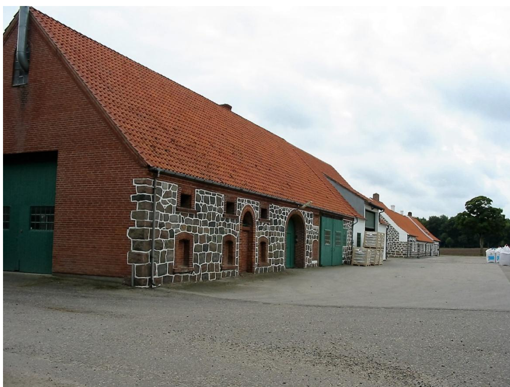
Smedien på Overgaard (2016)

- Nej, han havde arbejdet deroppe, før han flyttede til Stenalt, men da var han kommet uoverens med la Cour, forvalteren, men så havde la Cour sendt bud efter ham igen, om han kunne komme, og det kunne han så godt. Og jeg mener, at han kom til at køre traktor deroppe, uden at jeg helt kan huske det, men så kom han i smedien bagefter, for han var jo smed, grovsmed. Det var det, han var uddannet til.