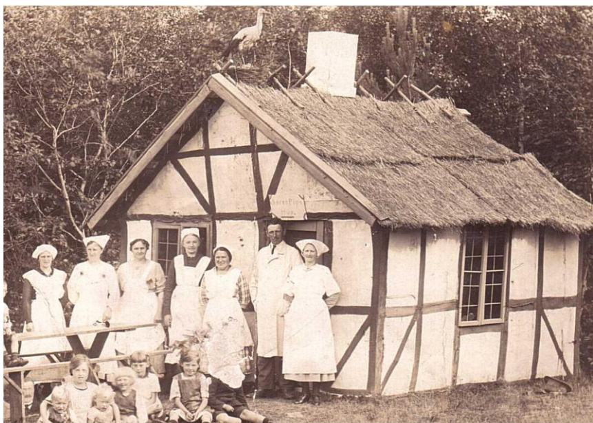
Æbleskivehuset på den gamle festplads i Plantagen 1921

Æbleskivehuset var bygget således, at det kunne tages ned efter børnefesten og stilles op igen til næste børnefest.