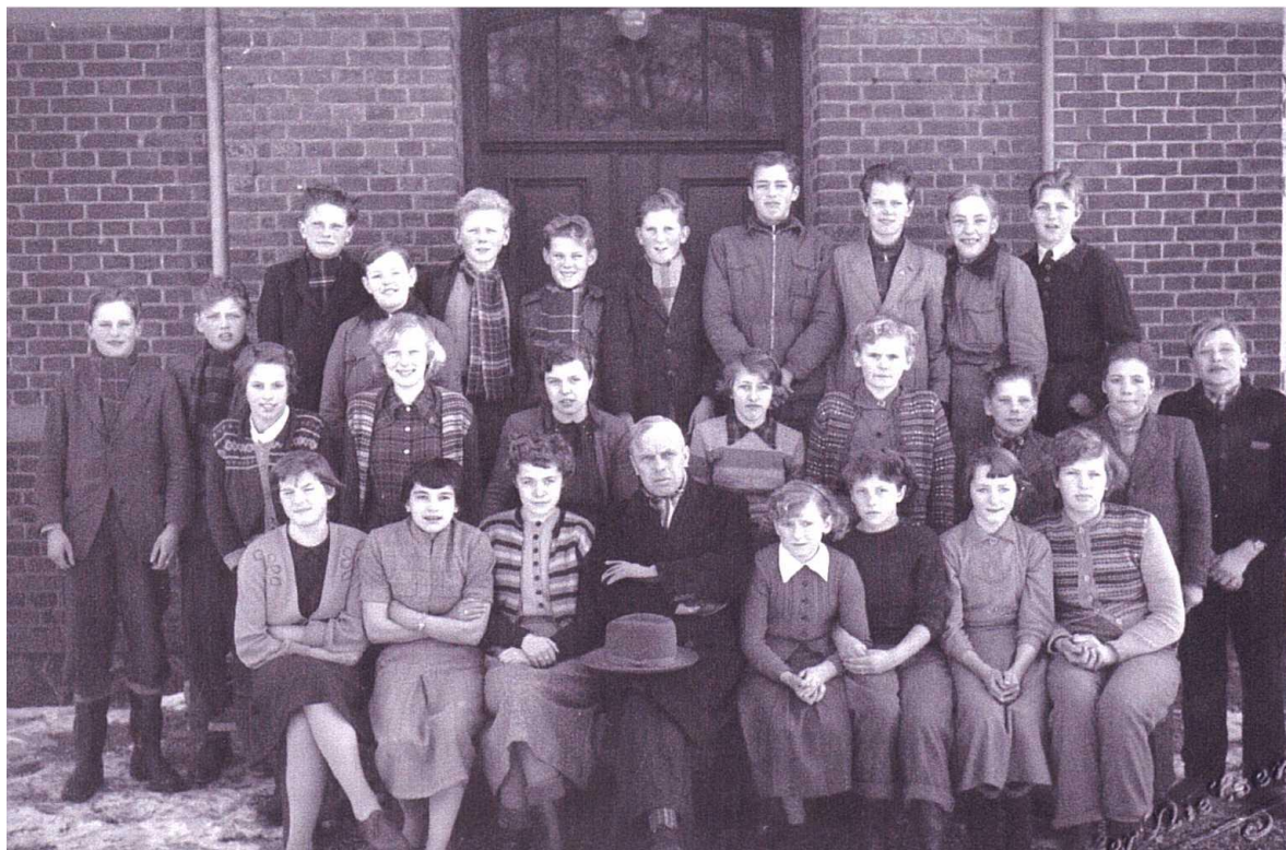
Konfirmation i Udbyneder kirke 27.03.1955