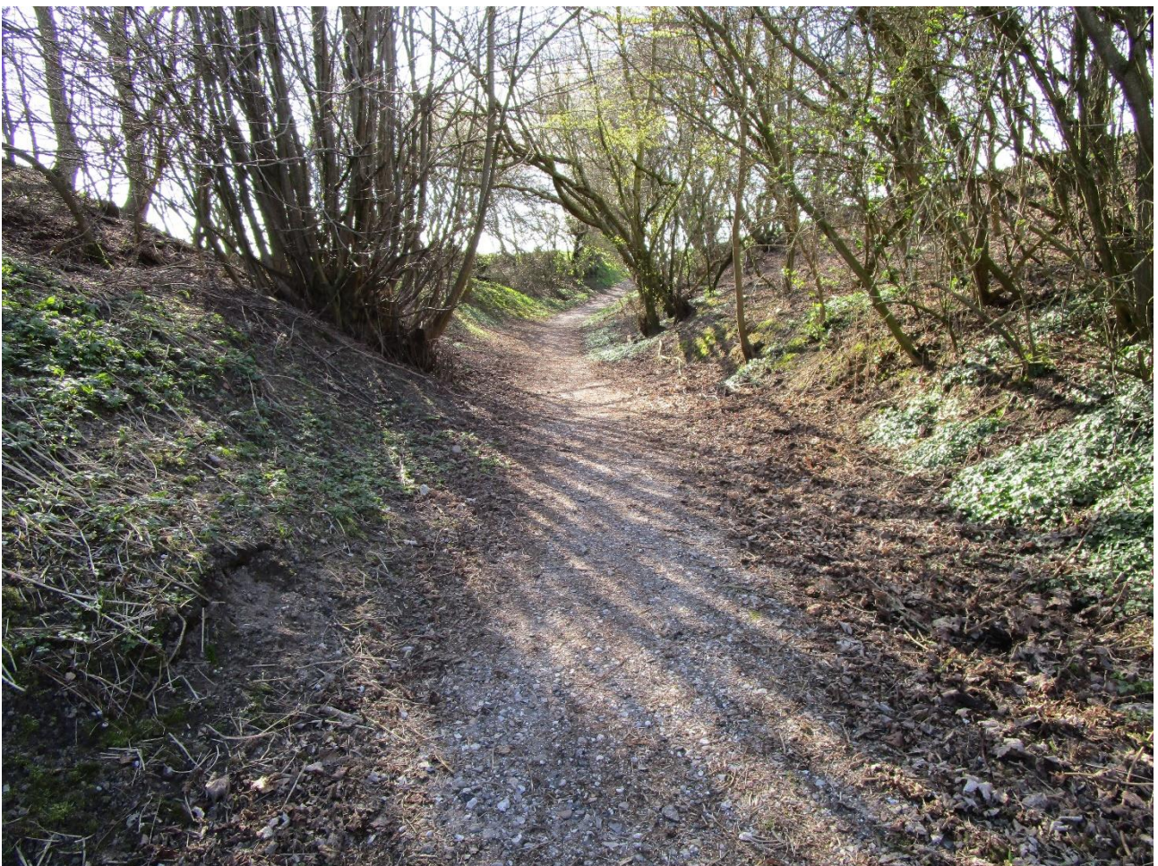
Slugten kaldet Hamborg set fra Udbyover mod vest

Det er nok det mest nærliggende at antage, at kortegen har passeret nord om gadekæret, forbi den gamle kirketomt op gennem slugten, kaldet Hamborg, videre et stykke ad Kongevejen igennem det, der dengang var Udbyover hede ( nuværende: syd for Havndal by og stadion ), indtil man drejede mod sydvest efter Dalbyover og Vinstrup og senere Gjerlev, måske ad Tønagervejen forbi Tinghøj.