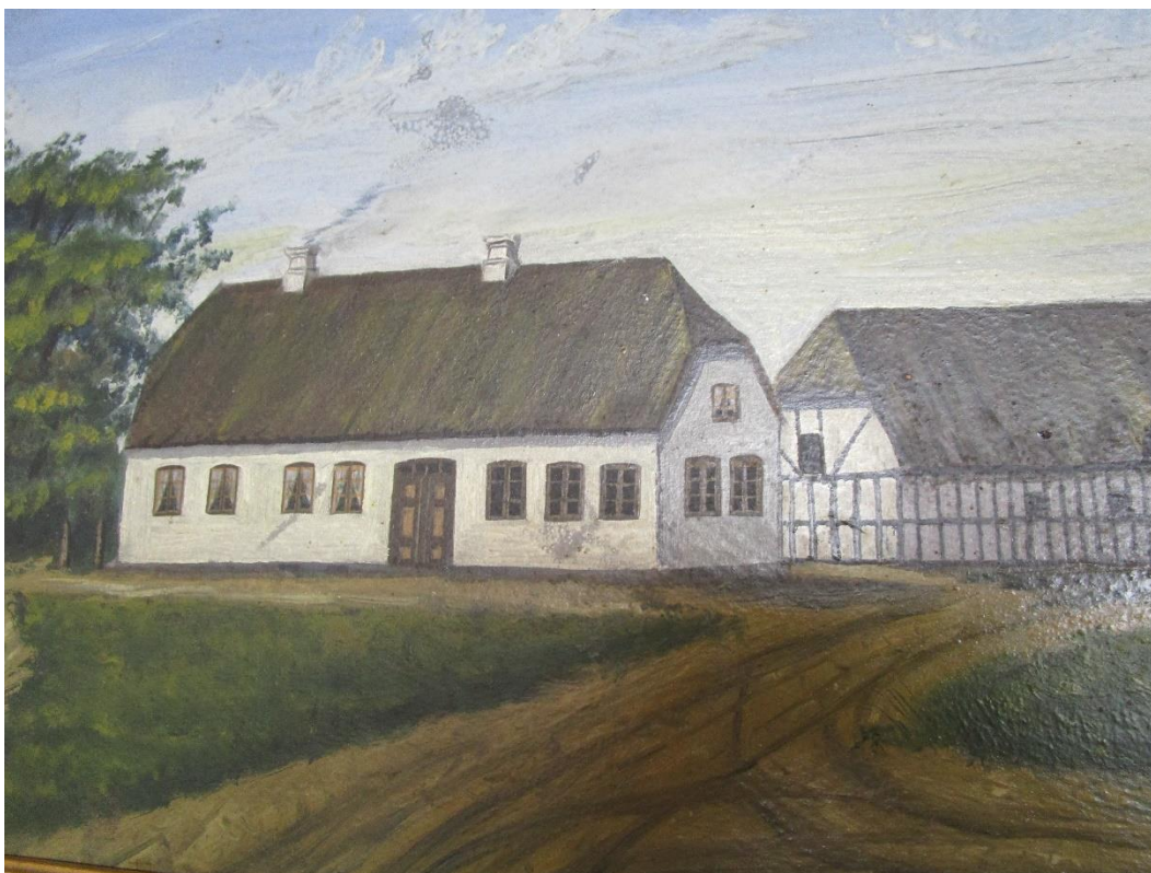
Udbyover skole ca. 1860