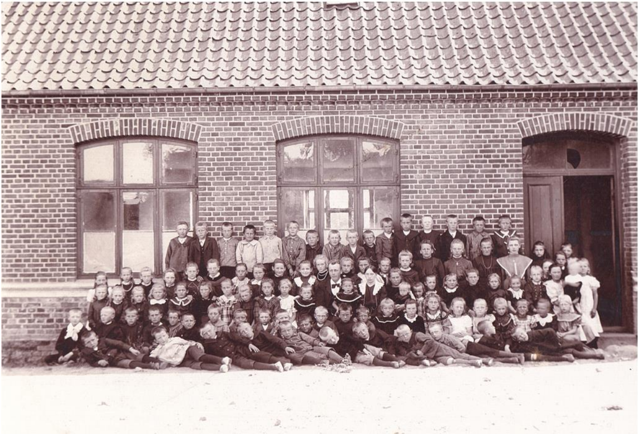
Udbyneder skole fra perioden 1905-1910